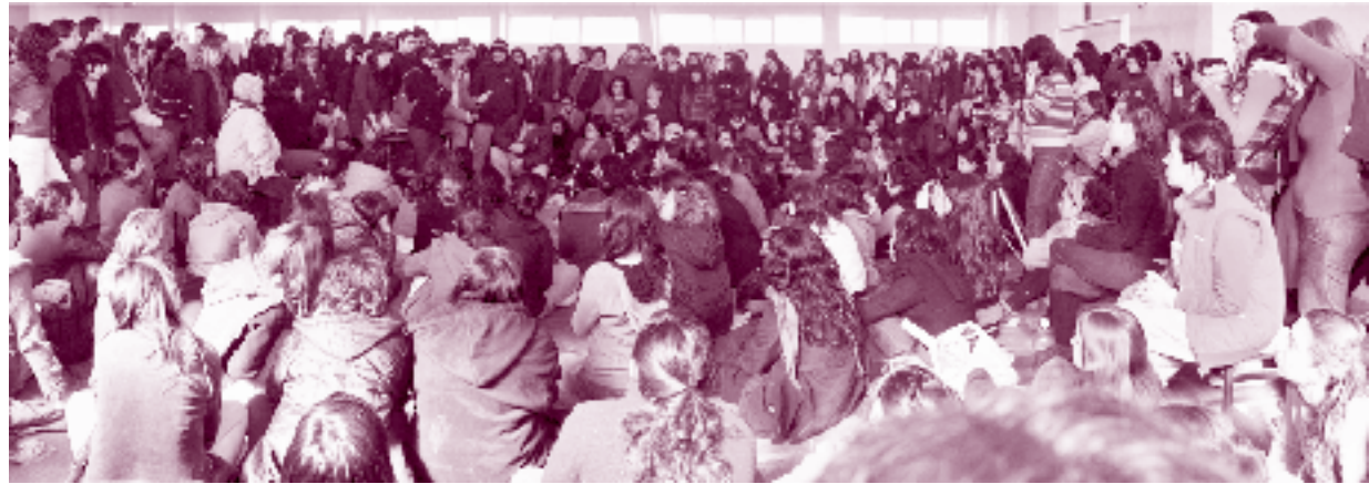
ZONA OESTE GBA

VISITA NUESTRO SITIO EN INTERNET www.pyr.org.ar PARA COMUNICARTE CON PAN Y ROSAS panyrosas@pyr.org.ar